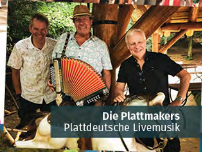
Die Plattmakers Plattdeutsche Livemusik