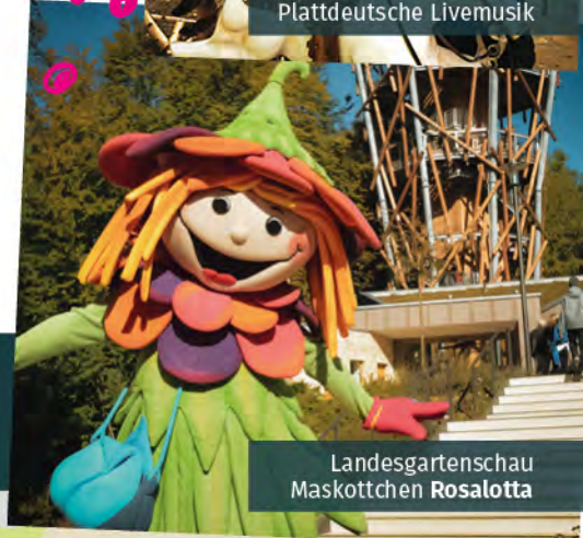
Landesgartenschau Maskottchen Rosalotta

Kleine Geländeübersicht FAMILIENFEST am Baumwipfelpfad